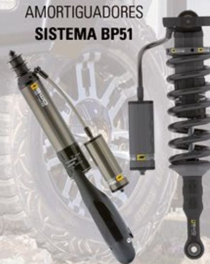
AMORTIGUADORES SISTEMA BP51