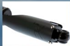
GUARDIA DE EJE REEMPLAZABLE, RESISTENTE A IMPACTOS