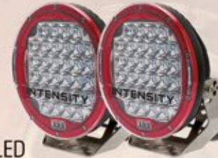
LUCES HALÓGENAS LED INTENSITY