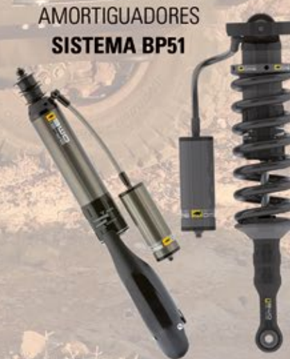
AMORTIGUADORES SISTEMA BP51