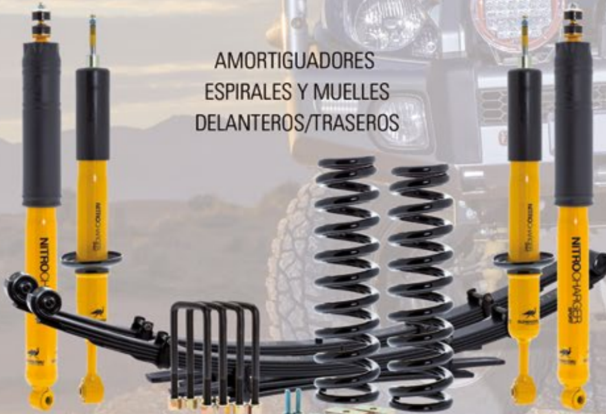
AMORTIGUADORES ESPIRALES Y MUELLES DELANTEROS/TRASEROS