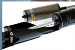
EJE DE SUPERFICIE EN FUERTE CROMADO DE 19mm