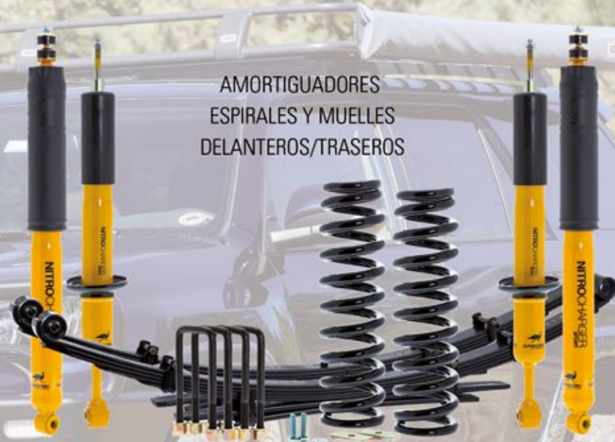
AMORTIGUADORES ESPIRALES Y MUELLES DELANTEROS/TRASEROS