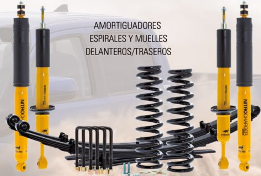
AMORTIGUADORES ESPIRALES Y MUELLES DELANTEROS/TRASEROS