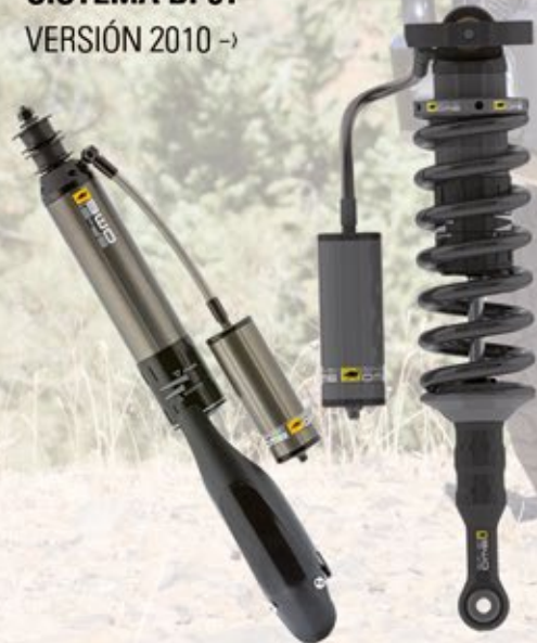
AMORTIGUADORES SISTEMA BP51 VERSIÓN 2010 ->