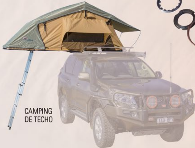
CAMPING DE TECHO