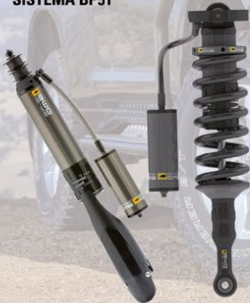
AMORTIGUADORES SISTEMA BP51