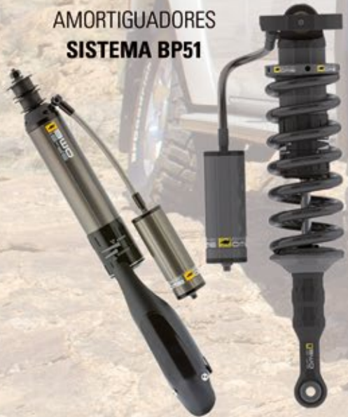
AMORTIGUADORES SISTEMA BP51