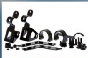
KIT DE INSTALACIÓN

Durante el proceso de desarrollo se realizaron extensivas pruebas de laboratorio, pruebas de campo y ensayos destructivos a fin de garantizar que la gama de amortiguadores BP-51 supere los impecables estándares de Confiabilidad, Durabilidad y Desempeño de ARB.