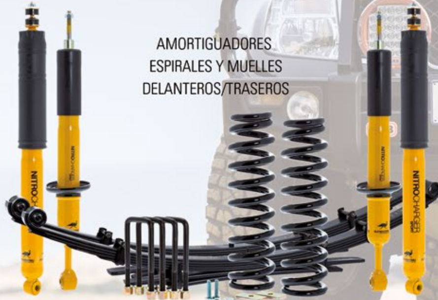
AMORTIGUADORES ESPIRALES Y MUELLES DELANTEROS/TRASEROS