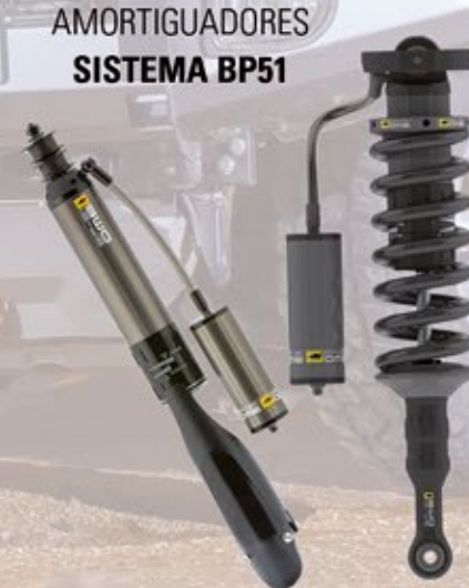
AMORTIGUADORES SISTEMA BP51