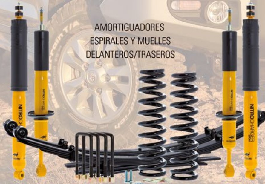
AMORTIGUADORES ESPIRALES Y MUELLES DELANTEROS/TRASEROS