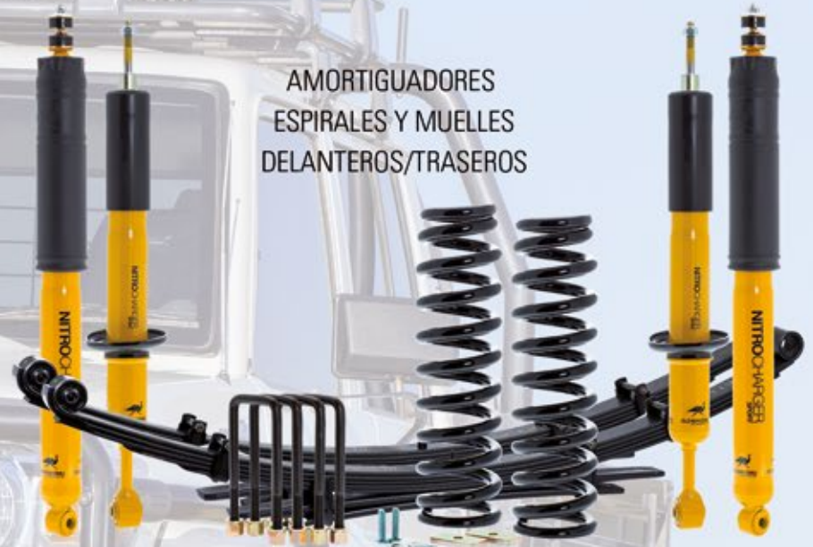
AMORTIGUADORES ESPIRALES Y MUELLES DELANTEROS/TRASEROS