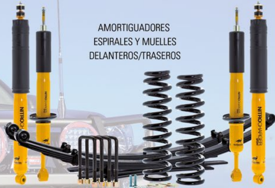
AMORTIGUADORES ESPIRALES Y MUELLES DELANTEROS/TRASEROS