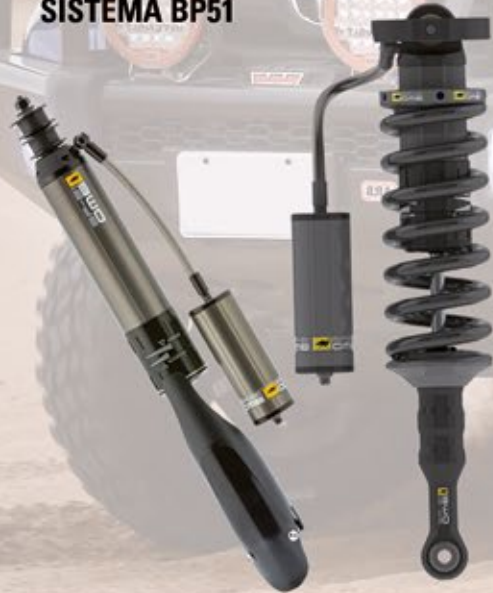
AMORTIGUADORES SISTEMA BP51